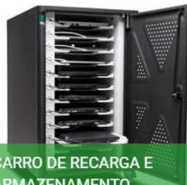
CARRO DE RECARGA E ARMAZENAMENTO