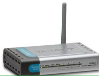
ROTEADOR DE REDE