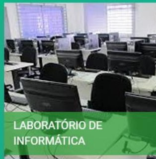
LABORATÓRIO DE INFORMÁTICA