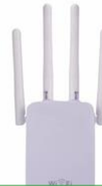
PONTO DE ACESSO