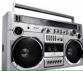
APARELHO DE SOM